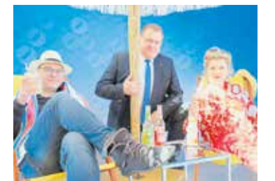
Die Herkuleskeule spielt im Sommer in njumii.

Tickets sind erhältlich unter www.reservix.de . Einfach nach „njumii“ oder „Die Erde hat eine Scheibe“ suchen