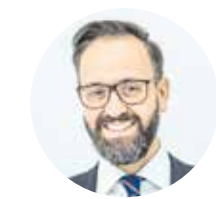
Sebastian Gemkow Sächsischer Wissenschaftsminister

Für das Handwerk besonders interessant ist, dass Sachsen es künftig