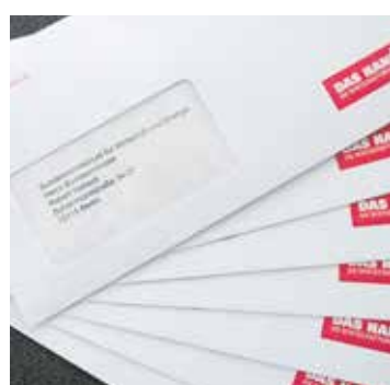
Ein gemeinsamer Brief soll die Poli- tik wachrütteln.