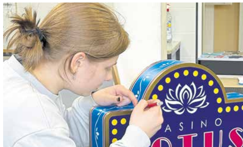
Als Juniormeisterstücke im Lichtreklamehersteller-Handwerk entstanden Leuchtelemente mit Schablonentechnik und Folienschnitt.

Im Bereich der Schilder- und Lichtreklame zeigten alle drei Jugendlichen großes Talent, empfohlen durch die Berufsorientierung der Hand-