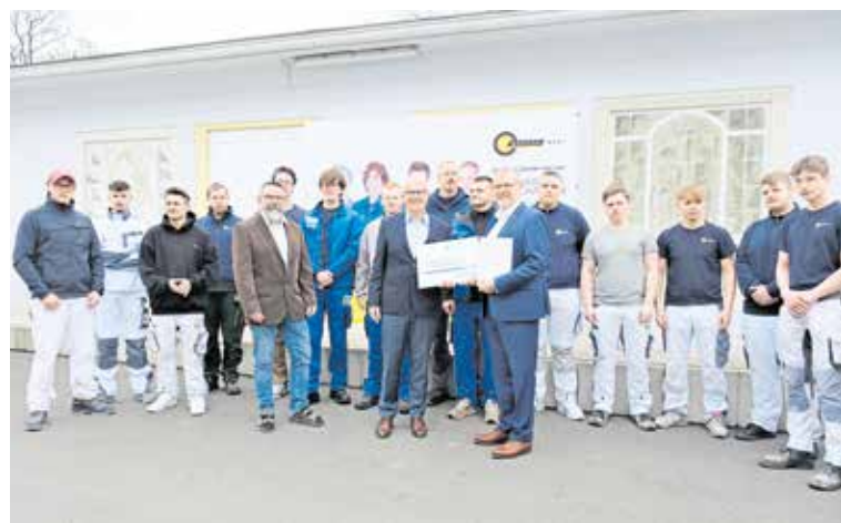
Premiere für den Bauhof West aus Dresden. Die Bauspezialisten erhielten erstmals die Urkunde für ihre Leistungen in der Lehre.

Vier Handwerksbetriebe aus der Landeshauptstadt Dresden haben die Auszeichnung „Vorbildlicher Ausbil-