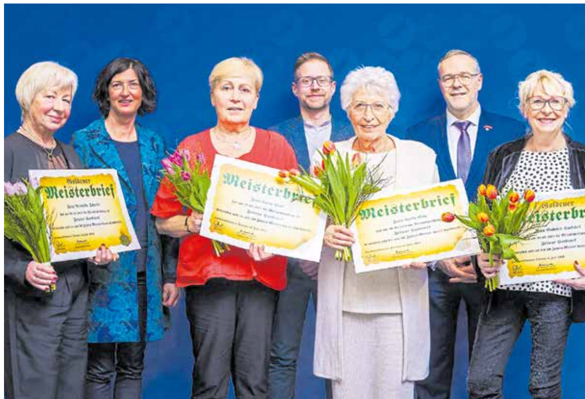
Die Friseurmeisterinnen blieben über viele Jahre sowohl ihren Kunden als auch ihrem Handwerk treu.