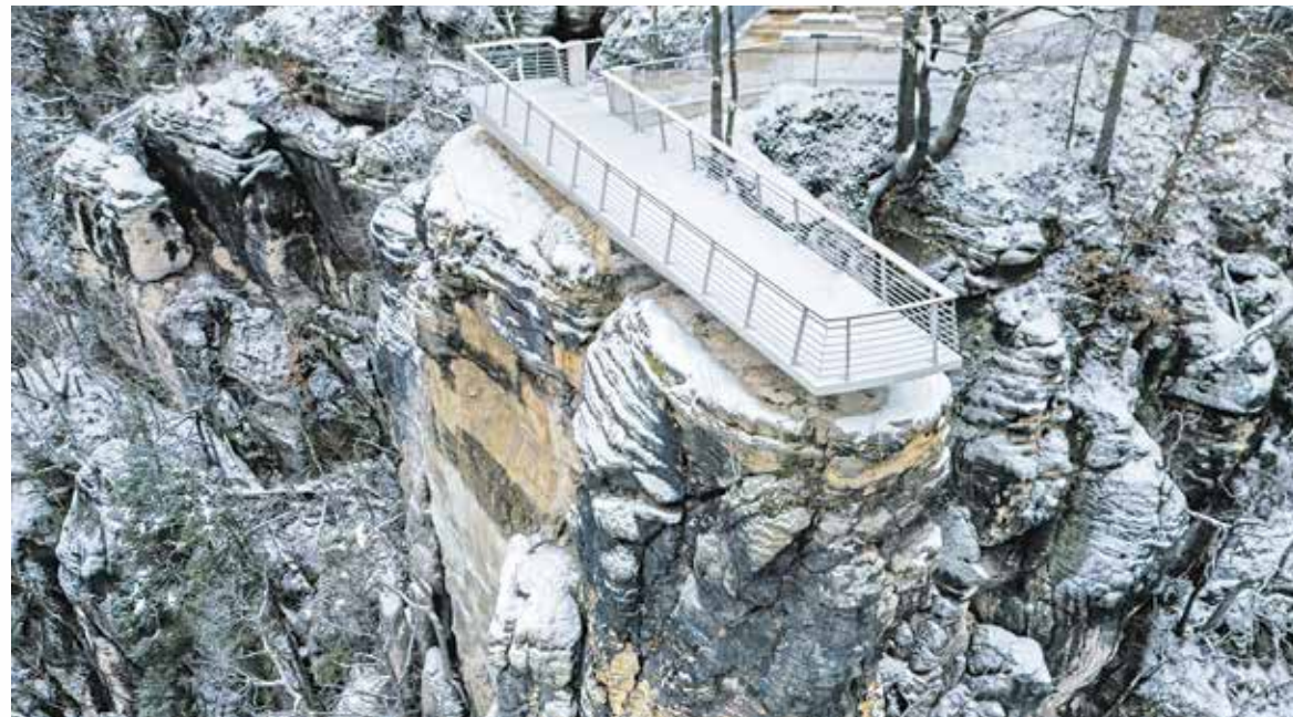
Die neue Aussichtsplattform schwebt auf einer Länge von etwa 10 Metern über dem vorderen Teil des Basteifelsens. Insgesamt ist die Plattform 20 Meter lang und bis zu 3,5 Meter breit.