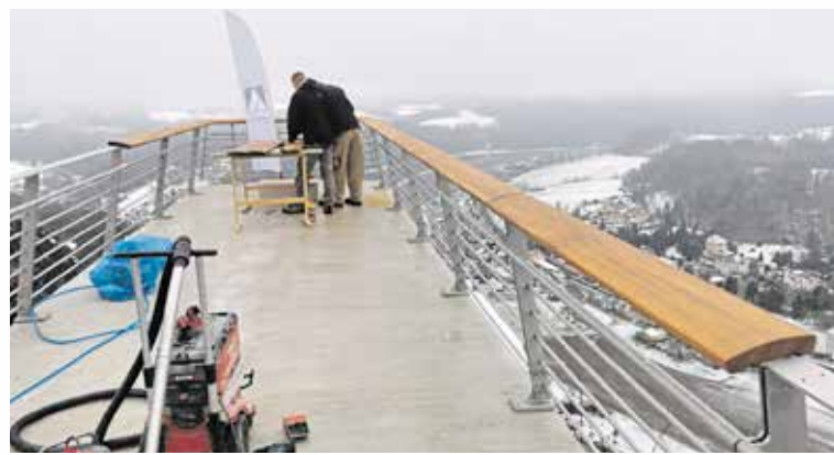
Arbeiten in 200 Metern Höhe über dem Elbtal bei Rathen.