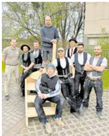
Beim Holztreppebau kommt es neben der Konstruktion auch auf Sicherheit an.

Der nächste Vorbereitungskurs der Zimmerermeister startet bereits im November 2026 - die Plätze sind schon jetzt vergeben. Auch der Kursstart im November 2027 ist bereits ausgebucht. Das zeigt deutlich, welchen Stellenwert das Zimmererhandwerk heute besitzt.