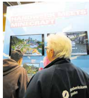
Das Minecraft-Spiel sorgte für Aufmerksamkeit.