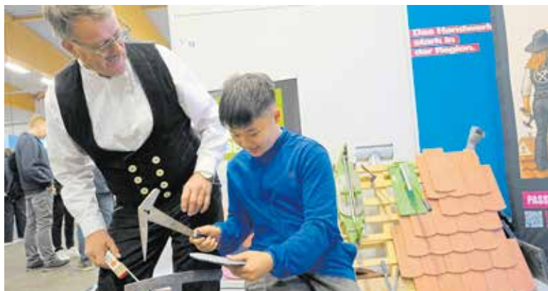
Handwerk macht Spaß. Bei der Dachdecker-Innung Dresden waren Jugendliche mit Eifer beim Schieferschlagen dabei.

zählt, erschaffen die Spieler eigene Welten und Gebäude aus würfelförmigen Elementen. Der Kreativität sind dabei kaum Grenzen gesetzt. Diese Parallelen zum realen Handwerk nutzte das Handwerk, um Auf-