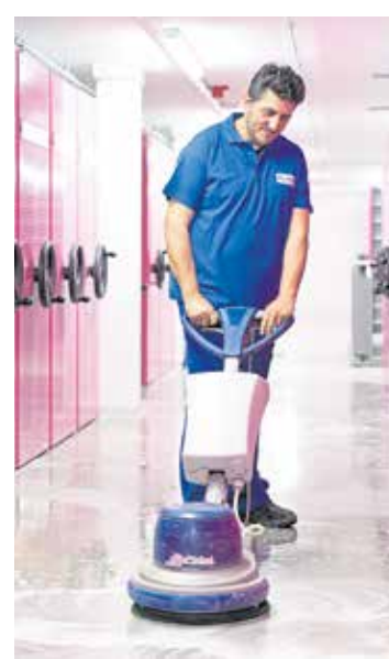
Kompetenzen können überprüft werden.

Die Handwerkskammer Dresden prüft daher nach Vorlage der ausländischen Bildungsnachweise den Grad der Gleichwertigkeit. Wird dabei festgestellt, dass eine volle Gleichwertigkeit besteht, erhält die Frau oder der Mann die gleichen Berechtigungen wie Personen mit einem deutschen Prüfungszeugnis.