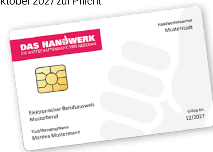
Mit der personenbezogenen Chipkarte im Scheckkartenformat werden sich Handwerker und Handwerksfirmen authentifizieren können.

Eine SMC-B benötigen alle Betriebe der Gesundheitshandwerke, die an die medizinisch-digitale Infrastruktur angeschlossen sind und Verordnungen elektronisch abrechnen. Einen eBA können freiwillig alle qualifizierten Betriebsinhaberinnen und Betriebsinhaber oder qualifizierten Betriebsleiterinnen und Betriebsleiter eines Betriebs des Gesundheitshandwerks beantragen. Dies sind Augenoptiker, Hörakustiker, Ortho-