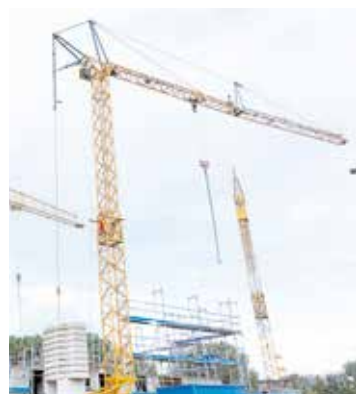
Der öffentliche Bau ist wichtig für das Handwerk.