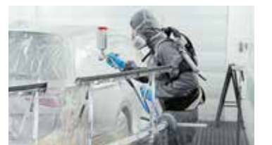
Exoskelette werden am 18. März gezeigt.