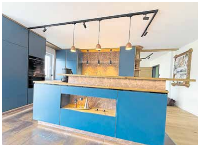
Die Tischlerei hat ein breites Leistungsspektrum. Möbel und Küchen gehören auch dazu.

Transparenz sehr wichtig. „Die Kunden können zu jeder Zeit vorbeikommen, um sich ein Bild von den Arbeiten zu machen“, erläutert er.