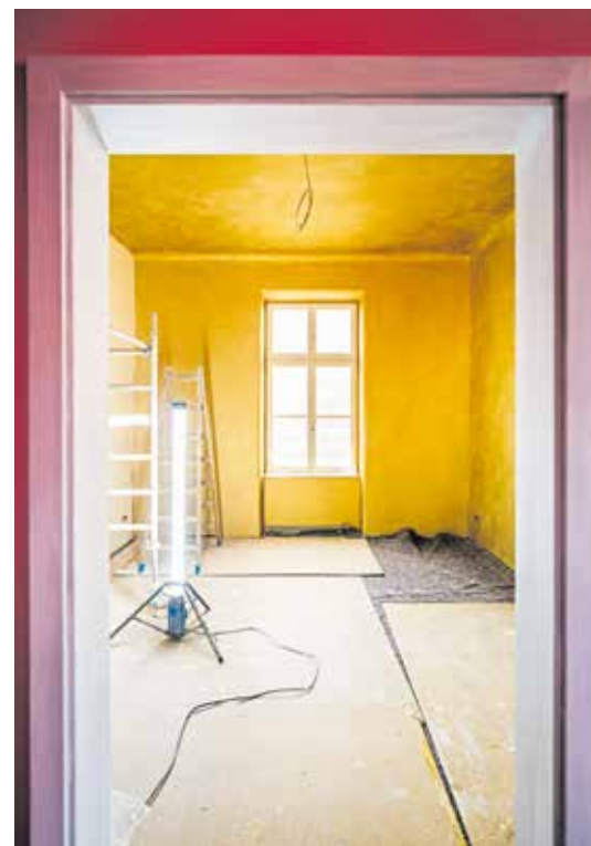
Ein Blick von außen in den goldenen Raum. Der Vorraum ist komplett in rosa gehalten.

„Das Material ist der Star. Es geht hier nicht um Perfektion.“