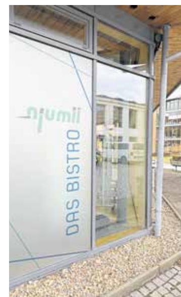
Das Bistro wurde sieben Monate saniert.

Mit der Wiederinbetriebnahme wurde zudem der Essensausgabenbereich neu und umgestaltet, um die Besucherströme künftig besser steuern zu können. Mit der Wiedereröffnung einher ging auch die