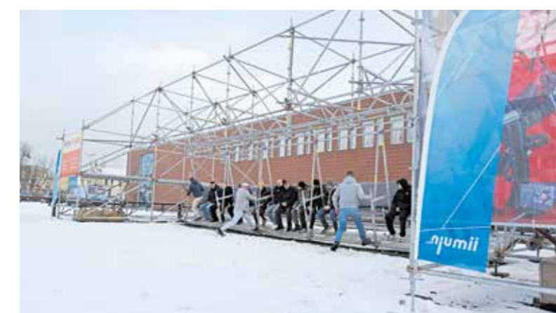
Zum Schwung holen auf der Schaukel vor njumii – das Bildungszentrum des Handwerks ist voller Einsatz nötig.

Etwa 60 Arbeitsstunden für den Aufbau, 40 Arbeitsstunden für den Abbau und unzählige Stunden für die detaillierte Planung und Berechnungen der Statik stecken in dem Rekordversuch. „Die Idee dahinter ist natürlich, das angewandte Handwerk mit ein wenig Spaß zu verbinden“, sagt Jörn Bindig. Denn so witzig die Schaukel auch aussieht, damit sie sicher steht und sich entsprechend bewegt, muss alles stimmen. „Es geht dabei zum Beispiel um die Statik, die Standsicherheit und die Traglasten. Ziel ist es, die Stabilität und Vielseitigkeit von Baumaterialien kreativ zu