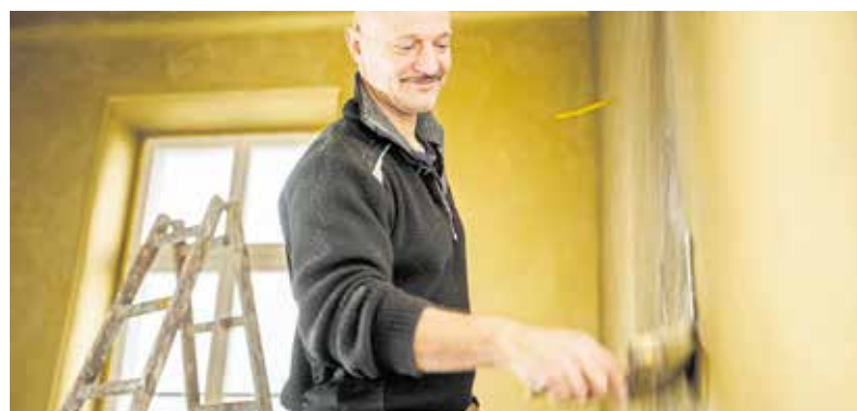
Malermeister und Restaurator bei der Arbeit im sogenannten „Goldenen Zimmer“. Auch der Handwerker spricht von einem „einzigartigen“ Projekt.

Mit den Arbeiten, die bis Anfang März abgeschlossen sein sollen, wird eine weitere Etappe im Rahmen der