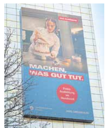
Nachwuchswerbung, die nicht zu übersehen ist.