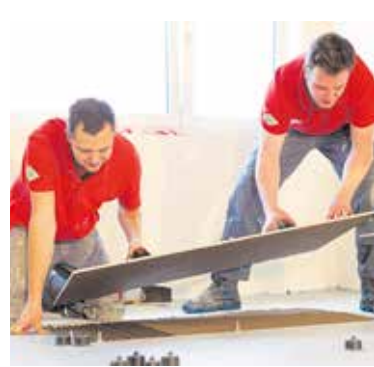
Die deutlichsten Rückgänge im Jahr 2025 gab es im Fliesen-, Platten- und Mosaiklegerhandwerk.

Rückläufige Betriebszahlen wiesen im vergangenen Jahr auch das Bauhandwerk (-113 Unternehmen), das Installateurhandwerk (-53) sowie das Maler- und Lackiererhandwerk (-52) auf. Angesichts schwacher Konjunktur fällt es immer schwerer, die Unternehmen an einen Nachfolger zu übergeben. Die hohe Bürokratie und die unsicheren Wirtschaftsprognosen schrecken qualifizierte Handwerker vor dem Aufbau einer Selbstständigkeit ab.