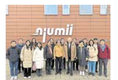
Delegation aus China im Bildungszentrum zu Gast.

Der Besuch basiert auf einem deutsch-chinesischen Regierungsabkommen und ist Teil einer seit Ende Dezember laufenden Weiterbildungsreise, die das deutsche System der beruflichen Bildung in den Fokus rückt. Im Mittelpunkt stehen Strukturen, Zielstellungen und Aufgaben der Lernorte im dualen System. Die Handwerkskammer Dresden ist seit Jahren ein stark nachgefragter Akteur auf dem Feld der Aus- und Weiterbildung ausländischer Fach- und Führungskräfte