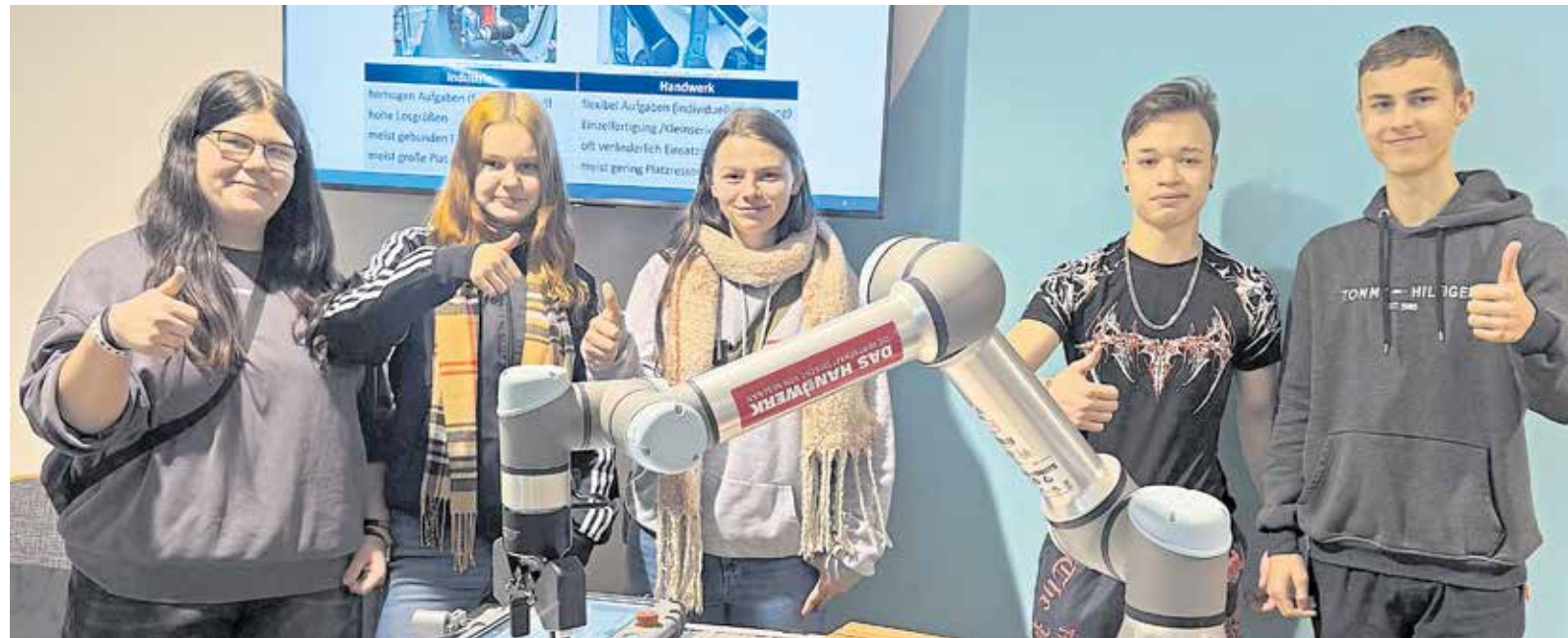
Gute Stimmung unter den Jugendlichen: Mit über 300 Schülern von 15 Schulen war die Veranstaltung „Erlebnis Handwerk“ sofort ausgebucht.

Bereits zum sechsten Mal fand die Messe zur Berufsorientierung auf dem Gelände der Handwerkskammer Dresden statt. Über 300 Schüler von 15 Schulen aus Dresden, Klipphausen, Freital, Moritzburg und Räckelwitz informierten sich an 25 interaktiven Stationen über das Handwerk. Von A wie Anlagenmechaniker bis Z wie Zimmerer konnten die Schüler herausfinden, welcher der 130 Berufe im Handwerk zu ihnen passt. Neu in diesem Jahr dabei waren zum Beispiel die Schornsteinfeger und Ofen- und Luftheizungsbauer sowie Hochbau- und Tiefbaufacharbeiter. Besonders gefragt und beliebt waren wieder die