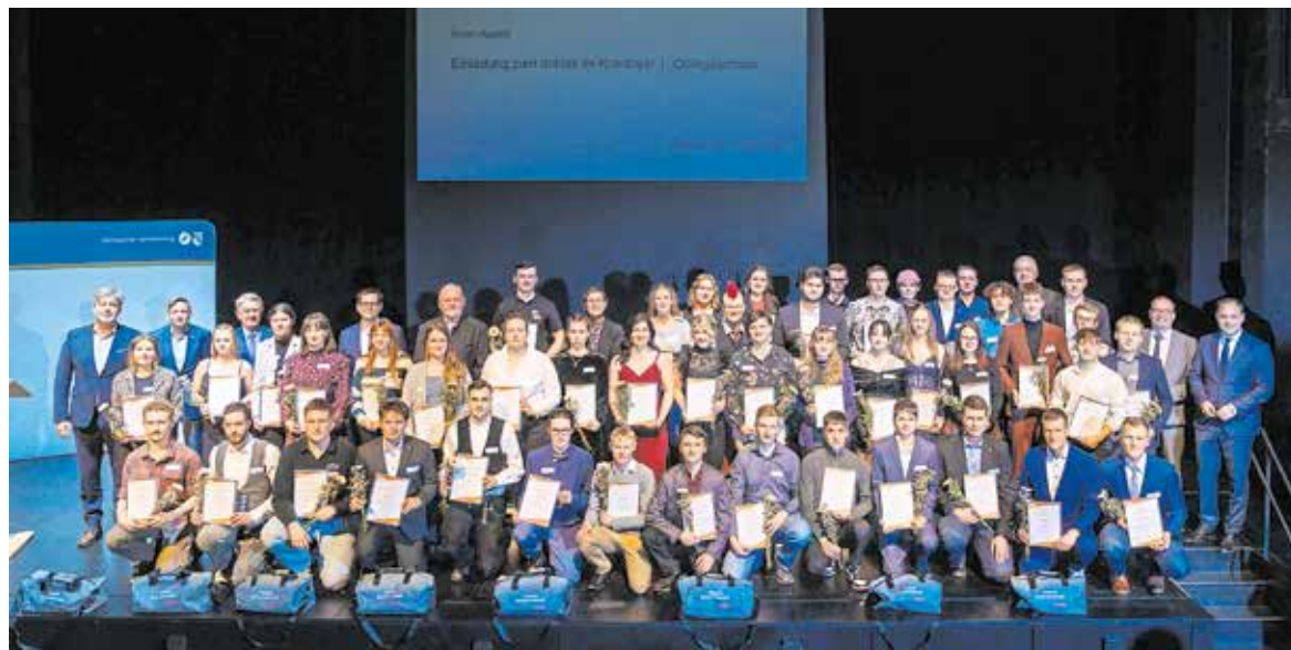
59 junge Frauen und Männer aus Sachsen haben bei der „Deutschen Meisterschaft im Handwerk – German Craft Skills“ den Sieg geholt, in Dresden wurden sie im Beisein von Ehrengästen dafür geehrt.

Landtagspräsident Dierks zollte den Junghandwerkern den Respekt, dass sie sich diesem Wettbewerb gestellt hatten. Er sei leider ein Mensch, der zwei linke Hände hat. Daher bewundere er das, was Handwerker mit ihren Händen erschaffen können. Das grenze manchmal an Zauberei.