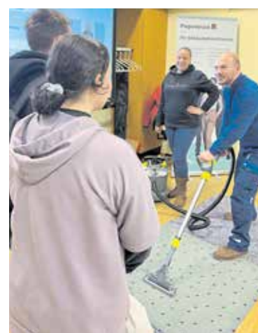
Die Gebäudereiniger begeisterten die Schüler mit Körpereinsatz.

Gebäudereiniger- oder Zahntechnikerhandwerk begeisterten die Handwerker die Schüler mit viel Engagement. Wie modern das Handwerk ist, zeigte die Handwerkskammer Dres-