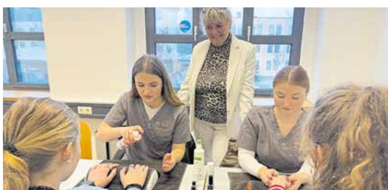
Wie viel Fachwissen und Präzision hinter dem Beruf des Kosmetikers stecken, erfuhren die Schüler bei „Erlebnis Handwerk“.

Ausprobieren und mitmachen war an den 25 Stationen ausdrücklich erlaubt - so testeten die Schüler bei den Schornsteinfegern auf einer Slackline ihren Gleichgewichtssinn, bei den Kosmetikern erhielten sie Tipps zur Hand- und Nagelpflege und verlegten bei den Anlagenmechanikern eine Fußbodenheizung. Am Stand der Handwerkskammer Dresden stand das Thema Robotik im Mit-