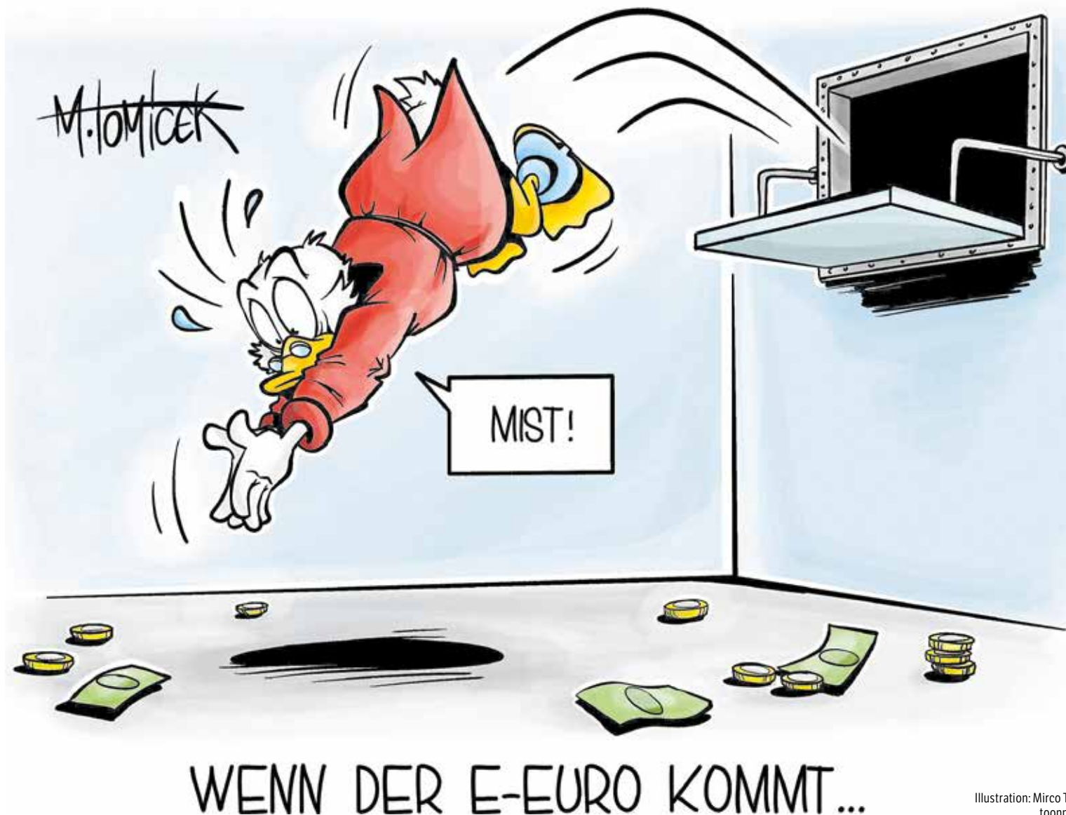
Illustration: Mirco Tomicek/toonpool.com

Für das Handwerk könnte der digitale Euro allerdings auch mit Investi-