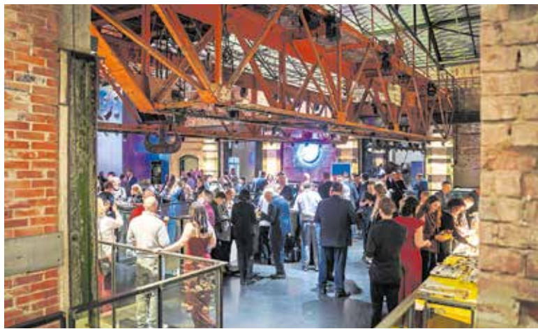
Die Festveranstaltung fand im Theater der jungen Generation in Dresden statt.

„Sie sind Vorbilder für unsere Gesellschaft“, betonte Alexander Dierks. „Sie sind fleißig. Wir alle müssen den Anspruch haben, fleißiger zu sein, um aus der Schwächephase zu kommen. Dafür brauchen die Unternehmen mehr Freiheit. Die wollen wir ihnen geben.“