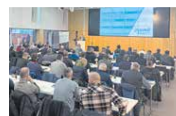
Fachtagung bot Plattform für Austausch in njumii – das Bildungszentrum des Handwerks.

Die nächste Fachtagung für Schweißaufsichtspersonen ist für den 30. Oktober 2026 vorgesehen – erneut in njumii. Einen Tag vorher, am 29. Oktober 2026, findet am glei-