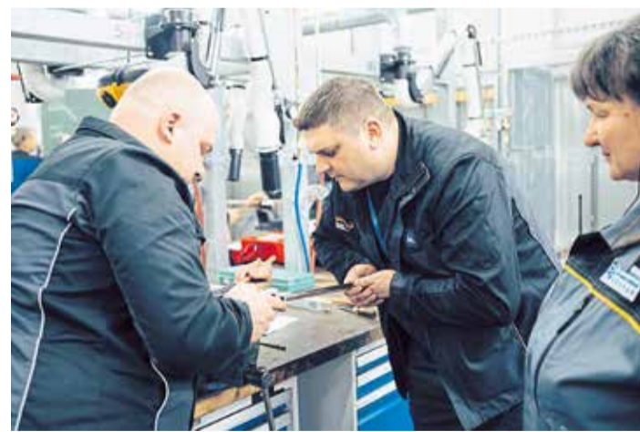
Lehrkräfte und Azubis aus der Ukraine sind seit 2021 regelmäßig zu Gast in njumii - das Bildungszentrum des Handwerks.

Gefördert vom Bundesministerium für wirtschaftliche Zusammenarbeit und Entwicklung (BMZ) geht es bei Berufsbildungspartnerschaft der Handwerkskammer Dresden um drei Auf-