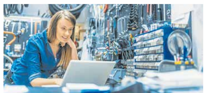
Ob Website, Social Media oder Onlinewerbung: Wer erfolgreich sein will, muss auch online sichtbar sein.