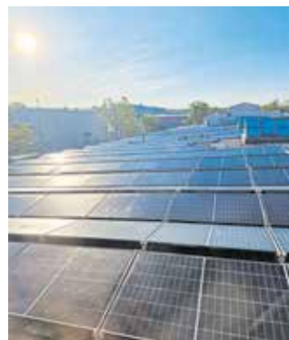
Kritisch beäugt das Handwerk kommunale Firmen.