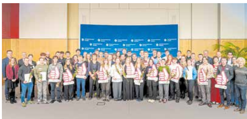
In Dresden wurden die besten Gesellen aus dem Kammerbezirk sowie die Stipendiaten geehrt.

Die Erfolge der jungen Handwerker seien der Beginn einer vielversprechenden Karriere und einer Verant-