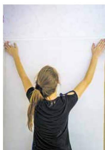
Hände hoch zum Anpacken heißt es bei Lernschwierigkeiten.

Spezielle Übungsaufgaben, das Ausbildungsnachweisheft, die Berufsschulnoten – es gibt viele Möglichkeiten zu überprüfen, was der Lehrling schon kann und wo es vielleicht Förderbedarf gibt. All diese Dinge sollten regelmäßig kontrolliert werden, auch um schlechtere Leistungen frühzeitig zu erkennen. So lässt sich jederzeit der betriebliche Ausbildungsplan individuell anpassen.