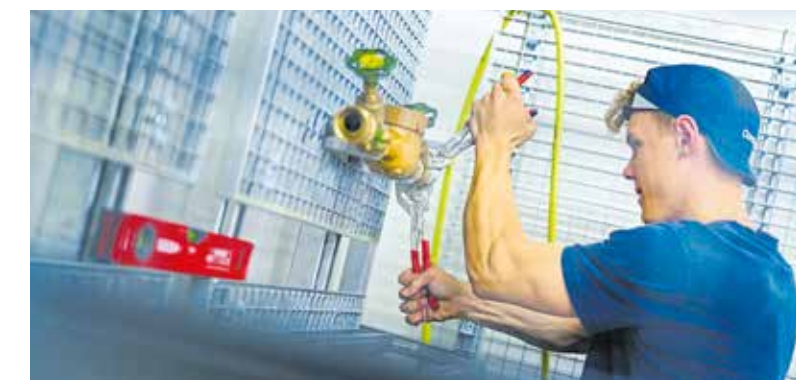
Der Ausbildungsberuf zum SHK-Anlagenmechaniker gehört zu den beliebtesten im Handwerk.

Der nach der Zahl der Lehrverträge beliebteste Ausbildungsberuf im Handwerk in Ostsachsen ist der des Kfz-Mechatronikers. 376 Frauen und