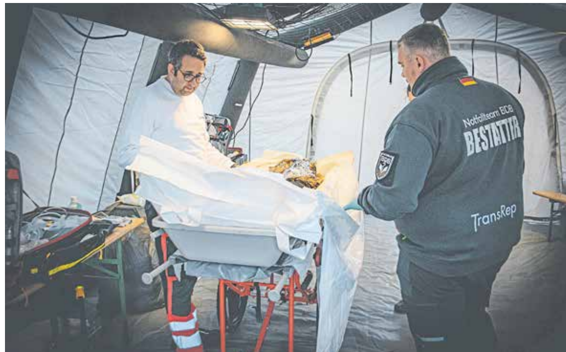
Das Notfallteam der Bestatter ist für den Krisenfall gerüstet, wie es zur europäischen Katastrophenschutzübung „Magnitude“ im Herbst 2024 auf einem ehemaligen Kasernengelände in Mosbach unter Beweis gestellt hat.

O-Plan Deutschland – Worauf sich Handwerksbetriebe im Verteidigungs- oder Katastrophenfall einstellen sollten VON ULRICH STEUDEL