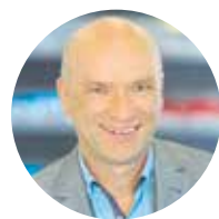
Ulrich Steudel Redakteur

Deshalb ist es richtig und wichtig, wenn sich Handwerksbetriebe auf Situationen einstellen, die ihr Geschäft bedrohen. Computersys-