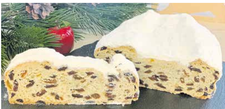
Das Umweltbundesamt hat auch auf Drängen des Handwerks hin die Regeln für Einwegverpackungen bei Stollen überarbeitet.

Auch Roland Ermer, Präsident des Zentralverbandes des Deutschen