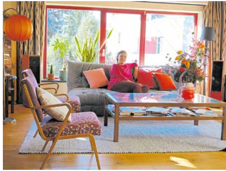
Das Wohnzimmer ist lichtdurchflutet und besticht mit bunten Farben allerorten.