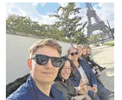
Die Raumausstatter besuchten auch den Eiffelturm in Paris.