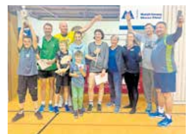
Spaß und Zusammenhalt standen im Vordergrund des Turniers.

13 Mannschaften haben in diesem Jahr am elften innungsübergreifenden Volleyballturnier teilgenommen, zu dem die Metall-Innung Oberes Elbtal eingeladen hatte. Den begehrten Wanderpokal holte sich nach 2022 wieder das Team der Fleischerinnung Dresden. Die Mission Metall wurde Vizemeister. In einem packenden Finish konnten sich die Vorjahressieger, die Meister der Kreishandwerkerschaft Bautzen, den dritten Platz vor den Druckmachern sichern. Mit am Start waren außerdem die Mitglieder der Innungen der Schornsteinfeger, SHK, Kfz und Zimmerer sowie das Team der IKK classic und Freunde des Handwerks wie der Handelshof Riesa und Radio Hanel. Dank aller Sponsoren und Teilnehmer kam in diesem Jahr eine Spendensumme von 1.600 Euro zusammen. Diese ging an den Freundeskreis - die Arche im Elbtal e.V.