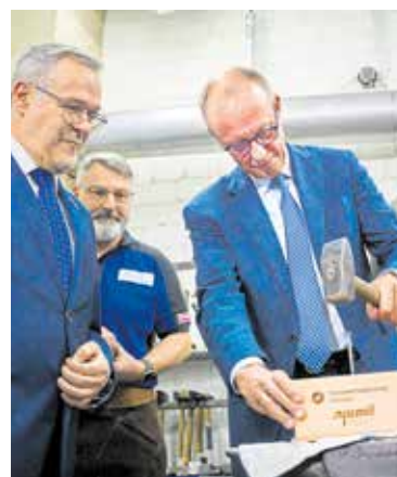
Der Kanzler schlug einen frischgeschmiedeten Nagel in der Schmiede ein.