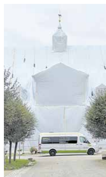
3.000 Quadratmeter Folie waren nötig, um das Gebäude komplett einzuhaufen.

„Unsere Arbeiten wurden durch starke, drehende Winde erschwert.