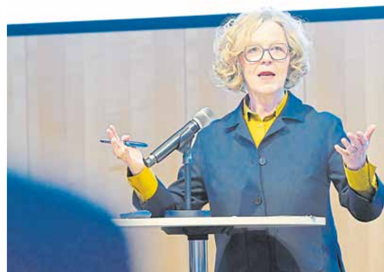
Staatsministerin Regina Kraushaar sagte, dass bis Mitte 2026 alle Bauämter in Sachsen digitaltauglich sein sollen.

Damit das Geld schnell auf die Straße kommt, braucht es eine „flotte“ Verwaltung. 42 untere Baubehörden gibt es in Sachsen. Bei 13 kann man Bauanträge digital stellen. Bei 28 weiteren sei man auf der Zielgeraden, schilderte Staatsministerin