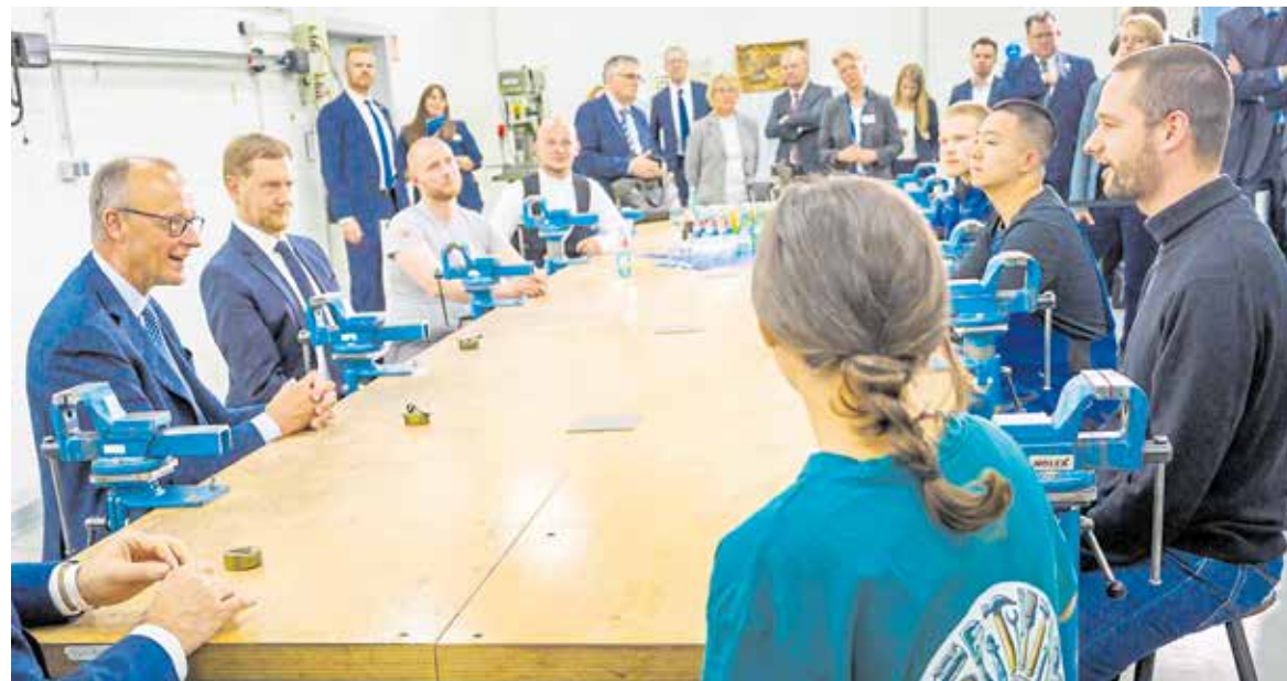
Im Austausch mit jungen oder angehenden Handwerksmeistern in der Metallwerkstatt von njumii – das Bildungszentrum des Handwerks erfuhren Kanzler (l.) und Ministerpräsident (2. v. l.), was das Handwerk umtreibt.

Bundeskanzler Friedrich Merz hört und bedankt sich für die mahnenden Worte, bleibt aber bei seiner Antwort eher im Allgemeinen. Stattdessen hebt der Regierungschef, der zuvor eine Stunde durch njumii – das Bildungszentrum des Handwerks gegangen ist, die Leistungen des Handwerks hervor. So betont der 69-Jährige: „Es beneiden uns viele Länder in der Welt um unser Modell der dualen Ausbildung.“ Gleichzeitig schlägt er einen ganz großen Bogen