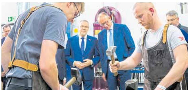
In der Schmiede von njumii – das Bildungszentrum des Handwerks schaute der Kanzler zwei angehenden Metallbauermeistern zu.

Friedrich Merz betonte, dass er den Austausch mit dem Handwerk