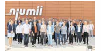
Treffen der Wirtschaftsförderer bei der Handwerkskammer Dresden.