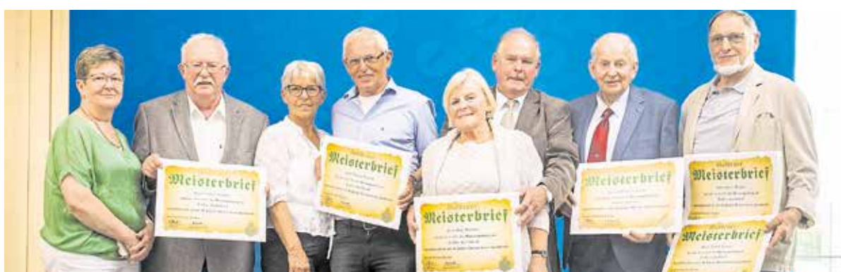
Goldene Meister: Die Bäcker – hier aus den Landkreisen Bautzen und Sächsische Schweiz-Osterzgebirge – stellten bei beiden Veranstaltungstagen die größte Gruppe.

Die Einladung zu den beiden Veranstaltungen nahmen neben Politikern auch zahlreiche Obermeister und Geschäftsführer der regionalen Innung an. Seite 7